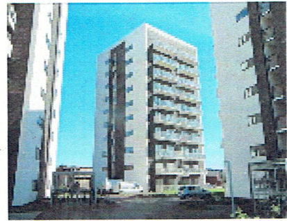
Ejerforeningen Åhusene 4